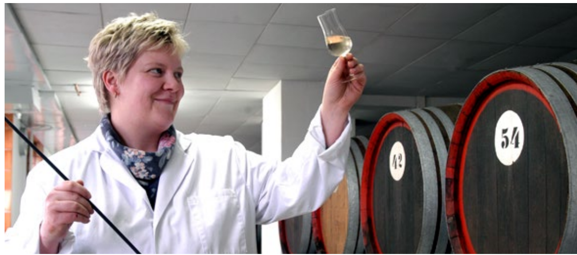
Produktionstätte Nordbrand Nordhausen