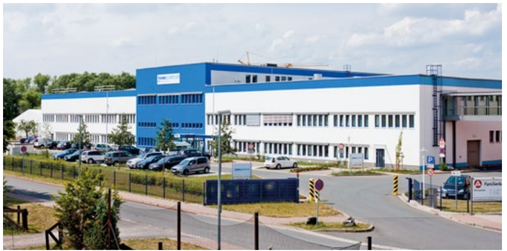
Firmengebäude von ThimmSchertler