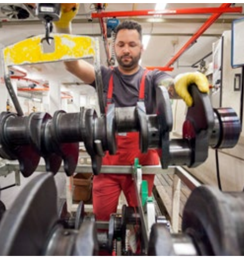
Mitarbeiter von Feuer Powertrain