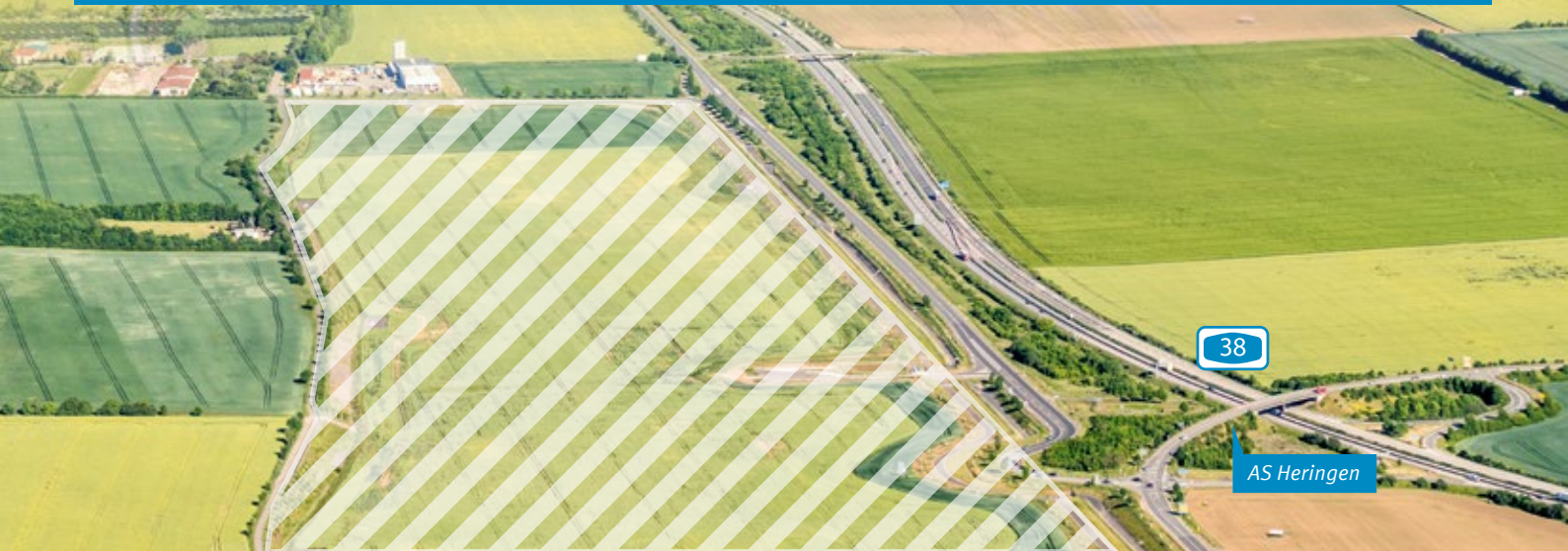
Luftbild Industriegebiet „Goldene Aue“ in Nordhausen