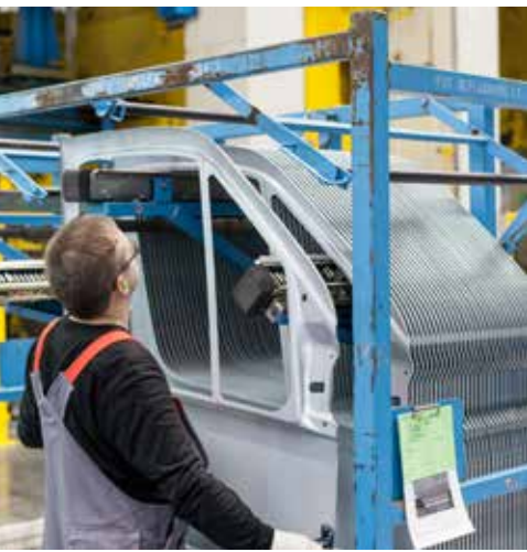
Mitarbeiter von Tower Automotive