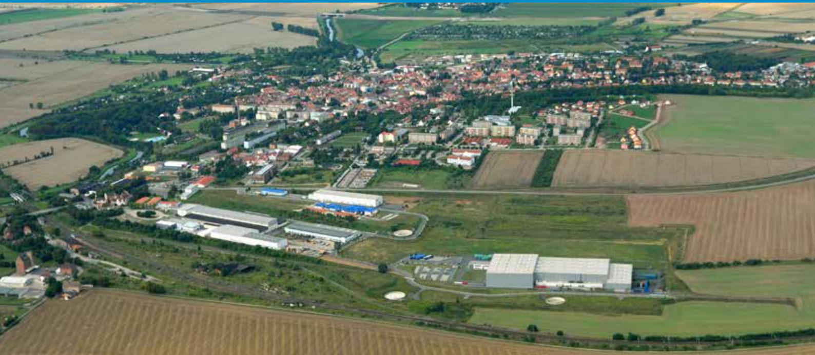
Luftbild Industriegebiet „Kyffhäuserhütte“ in Artern