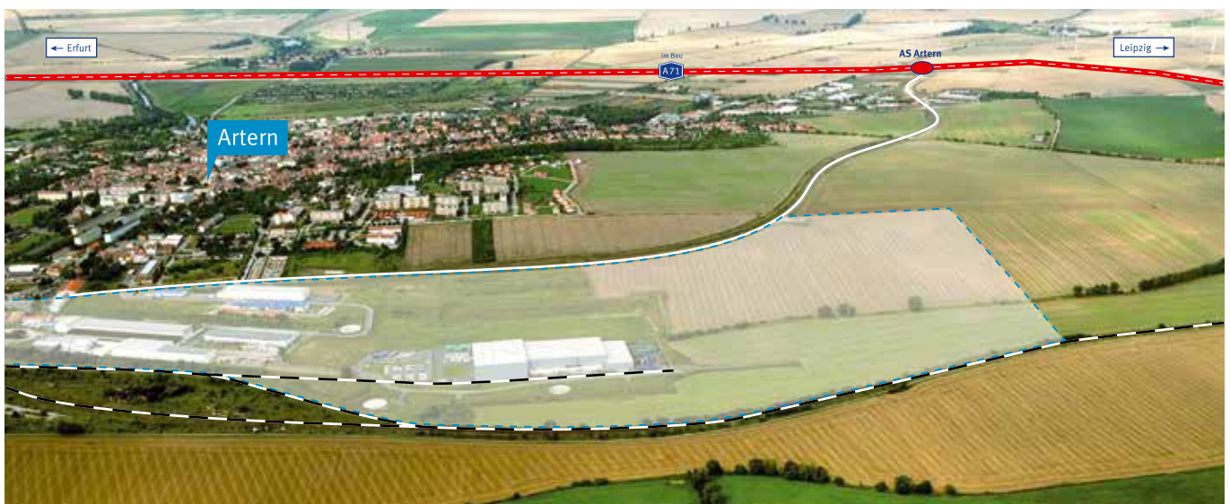
Flächen im Industriegebiet und Anschluss an die A 71