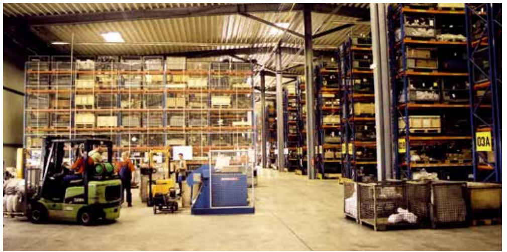
Logistikhalle am Standort